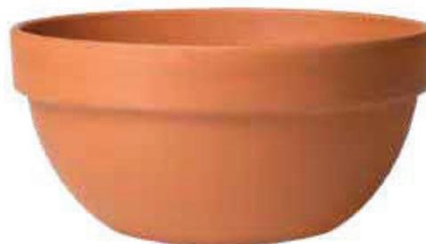
INFO PAG: 120