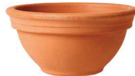
INFO PAG: 122