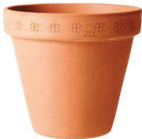
INFO PAG: 117