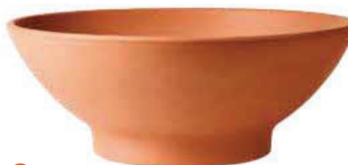
INFO PAG: 126